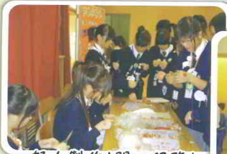
努力製作!開心服務!