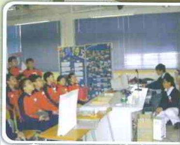
小學生一起來禁毒~~!