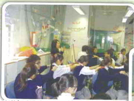
舒懷減壓--全賴有你支持!!